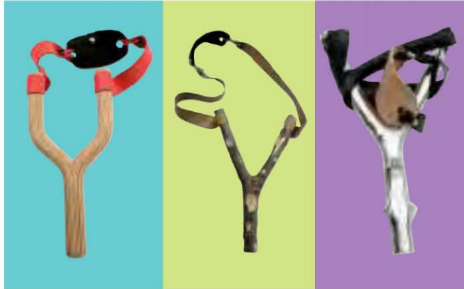
SLINGSHOTS Diseño: Karim Chaya ▲ Marca: Carwan