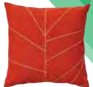
CUSHIONS Diseño: Lievore, Altherr, Molina ▲ Marca: Arper