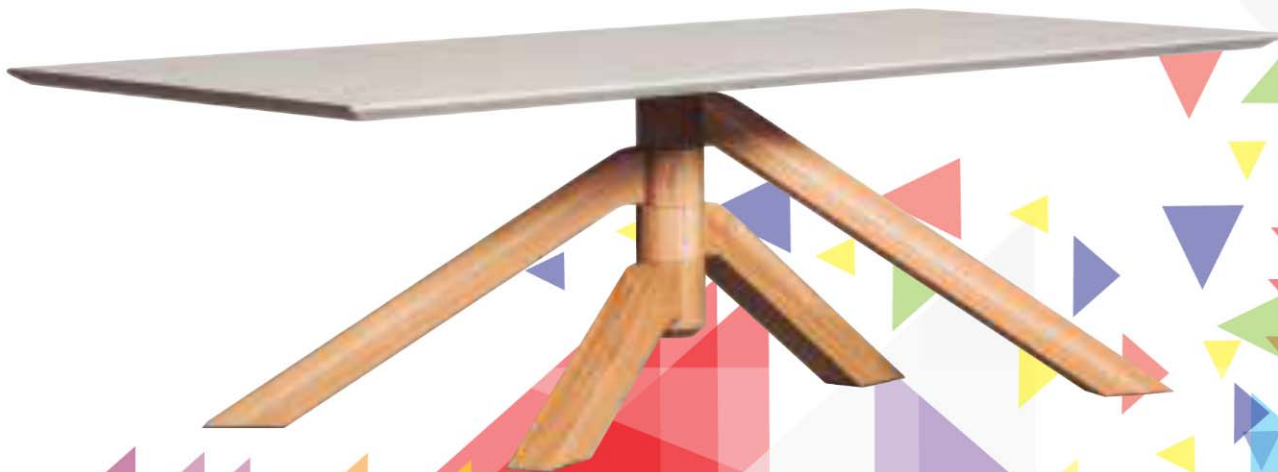
KEPLERO Diseño: Paolo Cappello ▲ Marca: Miniforms