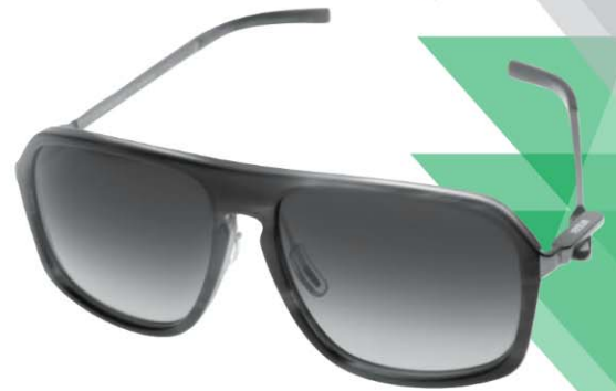
ALESSI EYES Diseño: Frederic Gooris ▲ Marca: Alessi