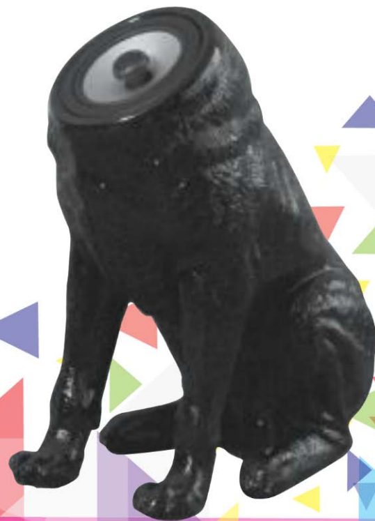
WOOFERS Diseño: Sander Mulder