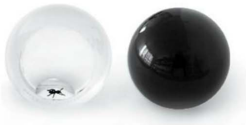
PISAPAPELES Diseño: Sam Baron ▲ Marca: Petite Friture